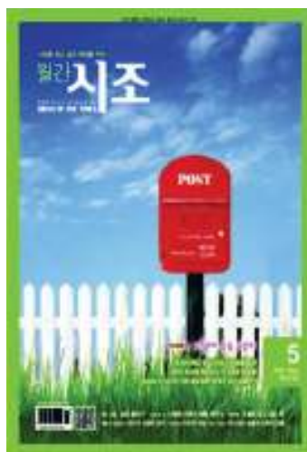
Корейското списание “Знамения на времето”

истории, отразяващи Божиата благодат и сила в живота на литературните евангелизатори по целия свят. При превода от английски на корейски, почувствах силно внушение от Светия Дух. Това беше глас, призоваващ ме пряко да участвам в литературното служене. След като два месеца превеждах тази вдъхновяваща книга осъзнах, че най-ефективният начин за мен да споделям Божиите благословения с другите е да се включа в литературния евангелизъм. Така през март 2009 г. се присъединих към литературното служене с благодарно сърце за всички благословения, кои-